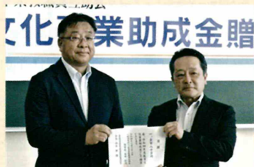
《本年度助成金贈呈式より》

岐阜県特別支援学校教育研究会、岐阜県小中学校教育研究会、岐阜県高等学校教育研究会、岐阜県事務職員研究会等をはじめ、教育関係の東海・全国の各種研究大会等、現職の教職員の皆様に 関係する団体にも多く助成しています。