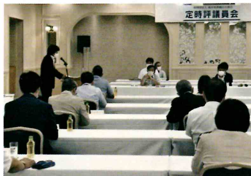
定時評議員会(6月20日開催)